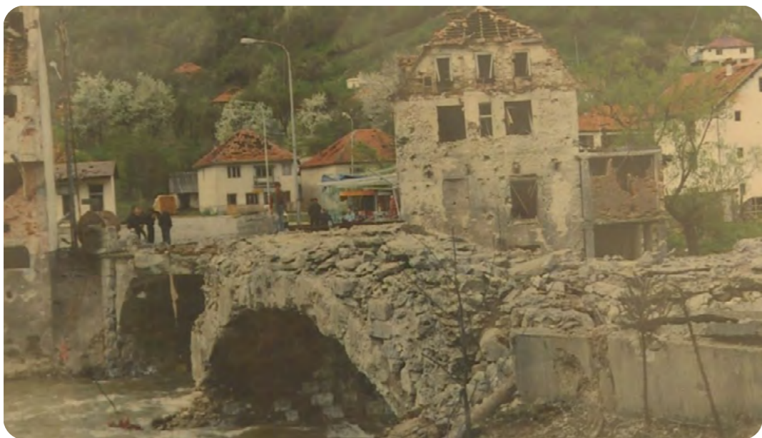
➔ Ura e shembur ne Murin 35

Familjet e prekura nga bombardimet paditën shtetin për dëmshpërblim, duke deklaruar se nuk ishin paralajmëruar për rrezikun, pavarësisht se NATO-ja njoftoi paraprakisht autoritetet për objektivat e planifikuara. Megjithatë, Gjykata Supreme e Malit të Zi e ka refuzuar kërkesën për dëmshpërblim për shkak të parashkrimit të pretenduar të kërkesës, pasi nuk ka filluar asnjë procedurë penale kundër atyre që është dashur t'i informojnë qytetarët për kërcënimin.