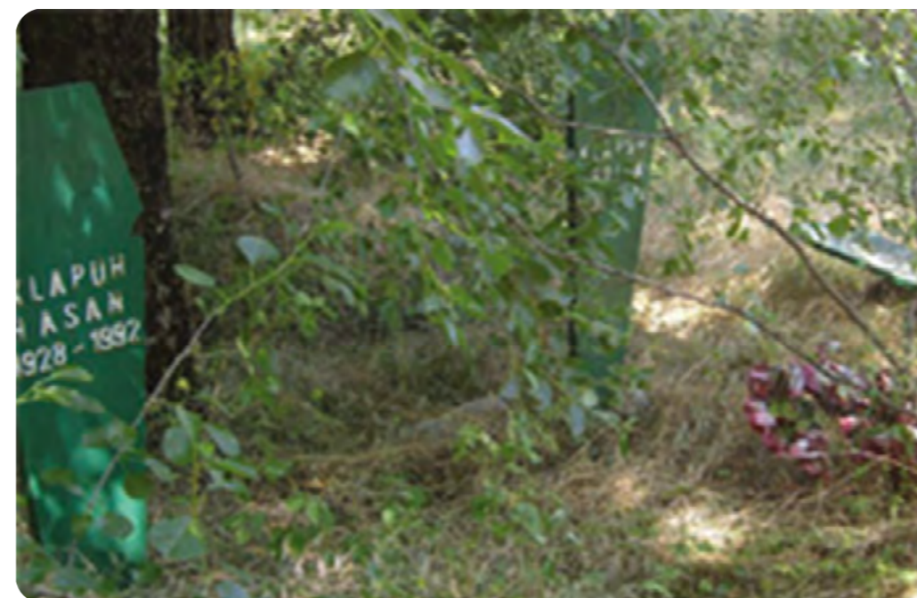
➤ Varreza e përkohshme në Nikshiq ku u varros familja Klapuh 83