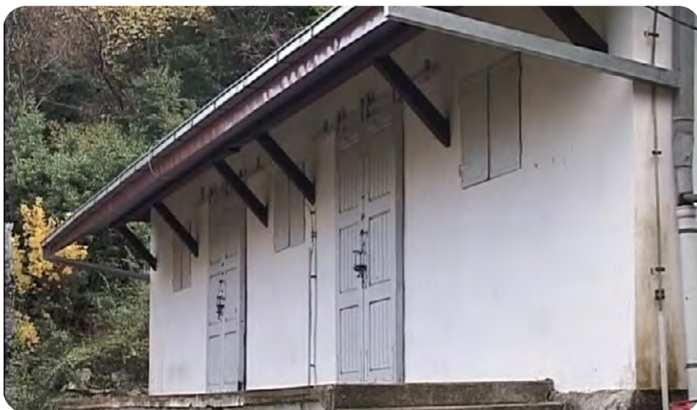
➤ Një nga objektet në Morinj ku u sollën të burgosurit nga fusha e betejës së Dubrovnikut nga viti 1991 deri në 1992 47