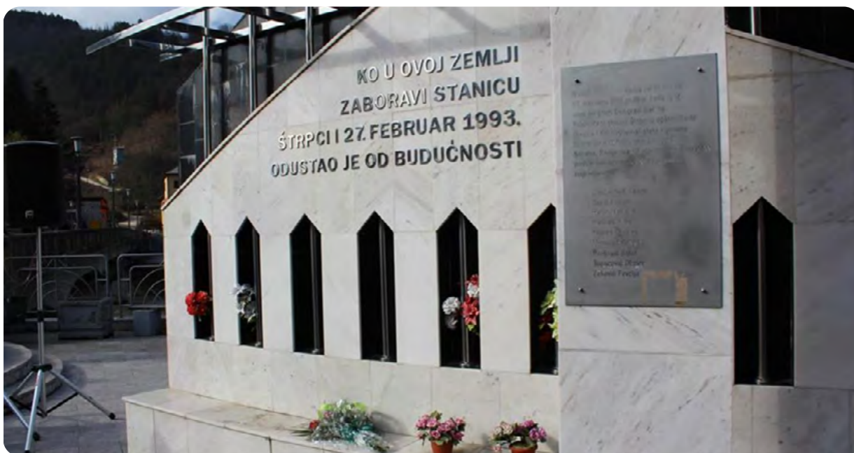
➤ Memorial për viktimat e rrëmbimit në Prijepole 91