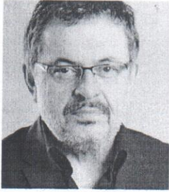
rukovodilac postdiplomskih magistarskih studija

Pozorišni reditelj. Radio kao profesor glume na Fakultetu dramskih umetnosti u Beogradu.