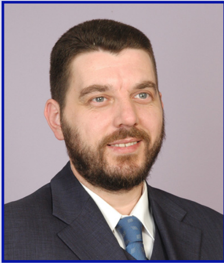
Piše: Emil Kriještorac

Kakvi su odnosi NATO-a i Evropske unije, odnosno Evropske bezbjednosne i odbrambene politike (ESDP)? Možda je najbolji odgovor na ovo složeno pitanje, u svom govoru na konferenciji u Berlinu početkom 2007, dao upravo Jap de Hop Shefer , generalni sekretar NATO-a. To prilikom je ustvrdio da ti odnosi ne liče na "zamrznuti sukob", ali da je začuđujuće koliko je malo prostora ostalo za saradnju.