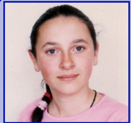
Piše: Jelena Šundić

Autor je učenik S4E, Elektrotehničke škole "Vaso Aligrudić" u Podgorici