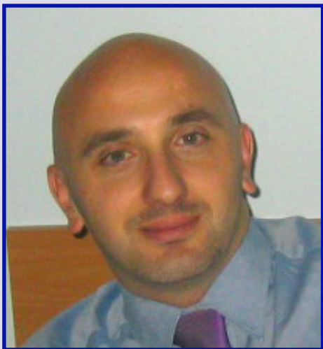
Piše: Aleksandar Saša Zeković

Evropska unija? Sui generis tvorevina. Najznačajniji, najintenzivniji i najuspješniji oblik udruživanja država. Koncept koji počiva na ljudskoj saradnji i dimenziji prevazilaženja suprotnosti. Projekat mira, ekonomskog i socijalnog progresa. Takođe, otvorena organizacija koja, pod određenim uslovima, omogućava pristupanje onima koji su u tom trenutku van nje.