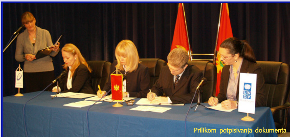
Prilikom potpisivanja dokumenta

Prvi značajniji korak nove Vlade ka jačanju administrativnih kapaciteta za proces pridruživanja Evropskoj uniji učinjen je 20. februara 2007. godine.