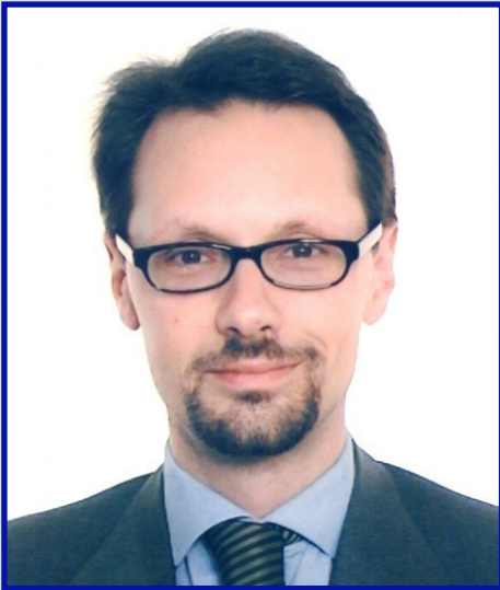
Piše: Giovanni Grevi

Dvije godine nakon neuspjeha Ustavnog ugovora na referendumima u Francuskoj i Holandiji, debata o institucionalnoj reformi Unije je ponovo u centru pažnje evropskih političara i na samom vrhu prioriteta predsjedavajuće Njemačke. Mada je još rano za ocjene o tome da li će se proces reformi uskoro vratiti na dnevni red, sa sigurnošću se može reći da je "ustavna" rasprava izašla iz faze hibernacije i da je u toku živa diskusija na svim nivoima, uključujući bilateralne konsultacije kojima Njemačka pokušava da ustanovi pozicije i mišljenja svake od članica EU.