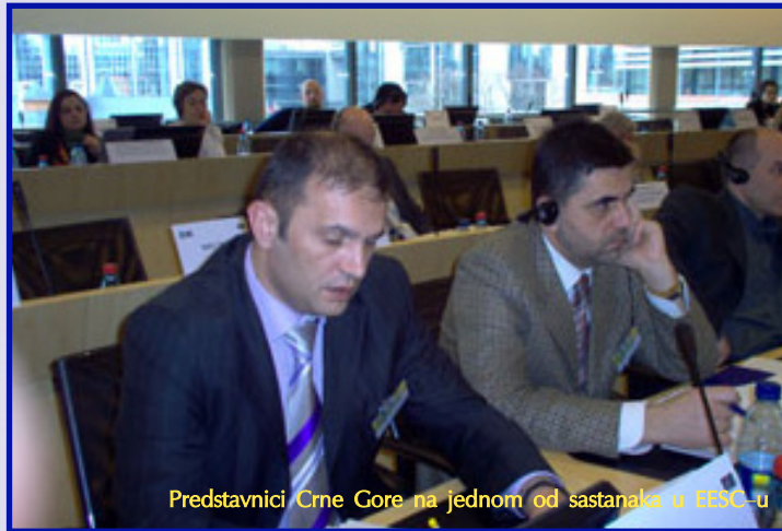
Predstavnici Crne Gore na jednom od sastanaka u EESC-u

Ekonomsko-socijalni savjeti su neizostavni dio tradicije razvijenih zemalja EU. Oni su formirani uglavnom na tripartitnoj osnovi, a čine ih jednak broj predstavnika Vlade, odnosno administracije, poslodavaca i sindikata. Kada je u pitanju Evropska unija, Ekonomsko-socijalni komitet (European Economic and Social Committee – EESS) je osnovan još Rimskim ugovorom kojim je 1958. godine uspostavljena Evropska ekonomska zajednica. Ugovor iz Nice je predvidio da broj njegovih članova ne može preći 350. U EU petnaestorice je ovaj Komitet imao 222 člana, a prije ulaska Bugarske i Rumunije bilo je 317 članova. Broj članova (čiji je