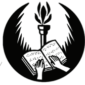
Organizata e të Verbërve për Nikshiq, Shavnik dhe Plluzhinë