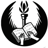
Savez slijepih Crne Gore