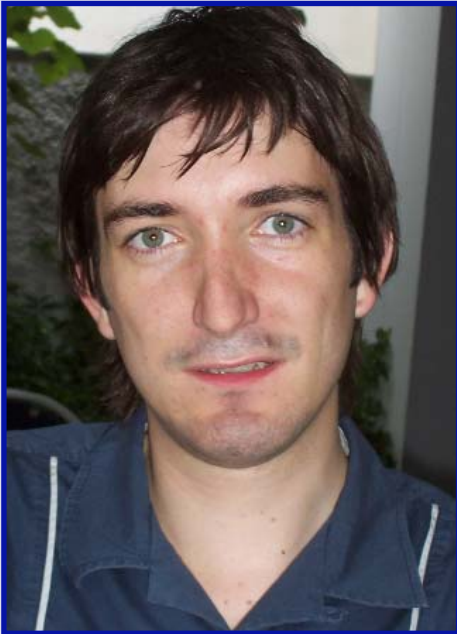
Piše: mr Vladimir Vučinić

Reforma javne uprave i jačanje njenih kapaciteta biće od ključnog značaja za proces evropskih integracija Crne Gore. Prenošenje acquis-a i njegova primjena su u najvećem dijelu u nadležnosti administracije. Shodno tome, put ka EU će zavistiti od kvaliteta i efikasnosti crnogorske administracije.