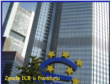
Zgrada ECB u Frankfurtu

Evropska centralna banka je osnovana 1. juna 1998. g. kao nasljednica Evropskog monetarnog instituta. To je bila i završna faza uspostavljanja monetarne unije na evropskom nivou, sa zajedničkom centralnom bankom i jedinstvenom valutom. Evropska centralna banka kreirana je prema takozvanom "njemačkom modelu", po ugledu na Bundesbanku, a sjedište joj je u Frankfurtu na Majni.