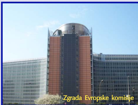
Zgrada Evropske komisije

"Što je ranije obećavano, sada će se ispuniti. Podgorica će brzo biti sjedište kancelarije Evropske komisije. Ne mogu reći kada će to biti jer nijesmo odredili datum, ali odluka da to učinimo je donijeta i radimo na njoj", rekao je Lloveras.