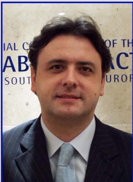
Piše: mr Dragan Stojović

Prema rezultatima Tranzicionog izvještaja za 2005. godinu Evropske banke za obnovu i razvoj, region jugoistočne Evrope privukao je oko 10 milijardi eura direktnih stranih investicija, što je svakako respektabilan i ohrabrujući podatak.