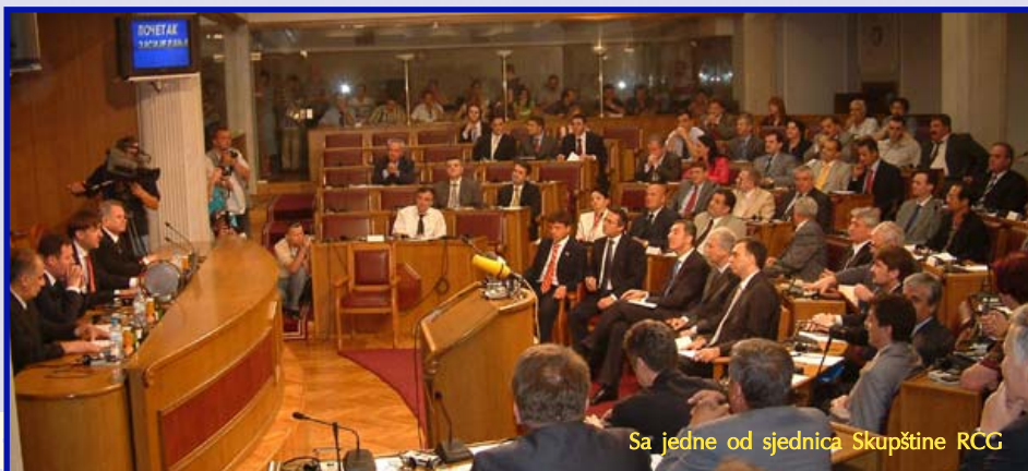
Sa jedne od sjednica Skupštine RCG

preuzela obavezu finansijske podrške nevladinom sektoru i Vlada je 2000. i 2001. godine bila zadužena za raspodjelu budžetskih sredstava.