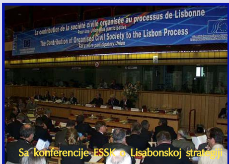
Sa konferencije EESK o Lisabonskoj strategiji

Evropski ekonomski i socijalni komitet je savjetodavni organ Evropske unije, koji okuplja predstavnike različitih interesnih grupa unutar civilnog društva i svojim studijama, preporukama i savjetima pomaže rad institucija – Savjeta Evropske unije, Evropskog parlamenta i Evropske komisije. Dok bank "demokratskog deficita" kruži Evropom, EESK predstavlja instituciju od neuporedivog značaja za saradnju između donosioca odluka u EU i civilnog društva. Evropski ekonomski i socijalni komitet osnovan je još 1957. godine. Ugovorom iz Rima ovaj je komitet ustanovljen kao mehanizam kojim bi se interesne grupe civilnog društva uključile u izgradnju zajedničkog tržišta i uspostavila komunikacija između ekonomskih i društvenih aktera EU i institucija EU. Komisija, Savjet EU i Parlament EU obavezni su da konsultuju Komitet pri donošenju odluka u oblasti ekonomske i socijalne politike. S druge strane, Komitet je slobodan da na sopstvenu inicijativu daje prijedloge u vezi sa svim drugim pitanjima koje smatra relevantnim.