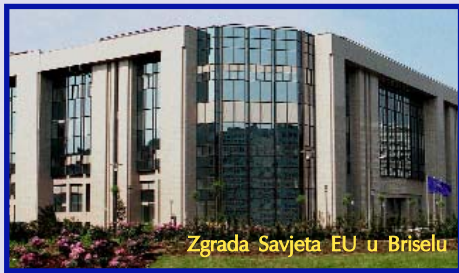
Zgrada Savjeta EU u Briselu

Uz sve napore da se među organima Evropske unije uspostavi mehanizam ravnoteže moći, Savjet Evropske unije, poznatiji kao Savjet ministara, i dalje je najmoćnija institucija, ako se izuzme Evropski savjet. Širina njegovih ovlaštenja ukazuje na činjenicu da, unutar Evropske unije, princip međuvladine organizacije i dalje ima prvenstvo nad principom naddržavnosti. U početku je Savjet ministara bio jedini organ odlučivanja u EU. Međutim, svaki novi ugovor dodatno je ograničavao njegove nadležnosti, pa su one sada podijeljene između Savjeta i Evropske komisije s jedne, i Evropskog parlamenta s druge strane. Doduše, Savjet je zadržao znatna ovlaštenja i u oblasti zakonodavstva, i kao organ izvršne vlasti. Savjet ministara okuplja ministre zemalja članica, i kao takav predstavlja neku vrstu kabineta nad kabinetima. Mada je pravno jedinstven organ, on nema uvijek isti sastav. Osnovna formacija Savjeta okuplja ministre inostranih poslova (tzv. Savjet za opšte poslove i inostrane odnose: General Affairs and External Relations Council – GAERC), koji se sastaju jednom mjesečno. U zavisnosti od predmeta rasprave, postoji još 9 mogućih formacija resornih ministara. Predsjedavanje Savjetom podijeljeno je među zemljama članicama po principu rotacije: svakih 6 mjeseci predsjedava druga država, a redosljed je unaprijed utvrđen. Trenutno je na poziciji predsjedavajuće Ursula Plassnik, ministarka spoljnih poslova Austrije.