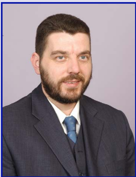
Piše: Emil Kriještorac