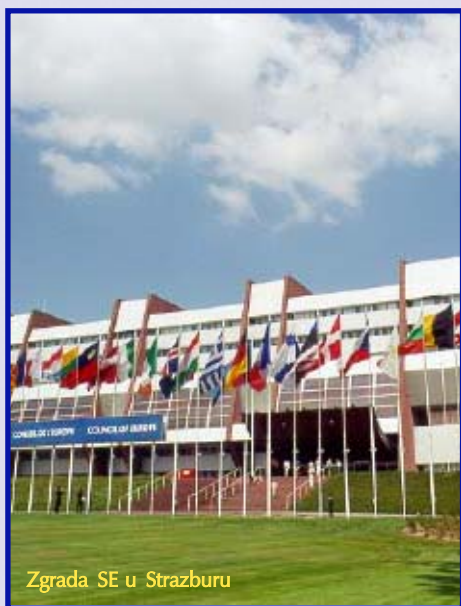
Zgrada SE u Strazburu

ŠTO PIŠE U NAJNOVIJEM IZVJEŠTAJU KOMITETA MINISTARA SAVJETA EVROPE O SRBIJI I CRNOJ GORI