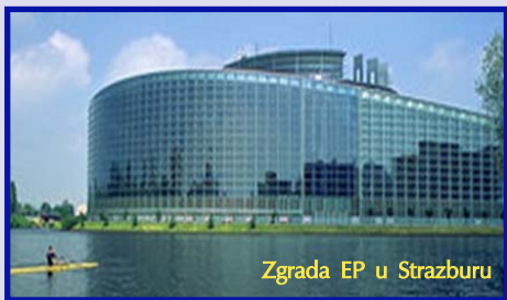
Zgrada EP u Strazburu

Evropskom parlamentu se može slobodno govoriti kao o jednom od najznačajnijih pokazatelja uspješnosti integracionih procesa u Evropskoj uniji i možda najočiglednijem elementu nadržavnosti ove institucije. Naime, iako parlament, ili skupština, nije rijetkost ni u drugim evropskim međudržavnim institucijama (Savjet Evrope, OEBS itd.), njihovi članovi postavljeni su od strane nacionalnih parlamenata. Evropski parlament je jedino međunarodno tijelo čiji se članovi biraju direktno, od strane stanovništva, na sve-evropskim izborima. Od 1979, ovi se izbori održavaju svakih pet godina.