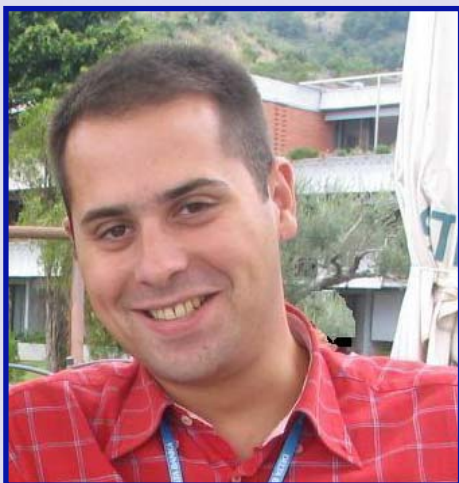
Piše: Ivan Jovetić