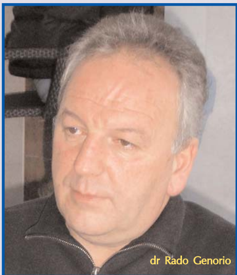
dr Rado Genorio

Evropa je već 2004. godine, uvođenjem dvostrukog kolosjeka, rekla da Crna Gora može brže sama ići putem pridruživanja Evropskoj uniji. Time je EU priznala da je struktura u Crnoj Gori sasvim drugačija nego u Srbiji, da su strukturni problemi u procesu prilagođavanja Crne Gore sasvim drugačiji nego u Srbiji. To smo priznali i prihvatili, time smo dali signal vašoj zemlji, a sada je na vama što ćete uraditi", kaže u razgovoru za EIC Bilten dr Rado Genorio, visoki zvaničnik Vlade Republike Slovenije koji je od početka 90-tih upravljao procesom pridruživanja Slovenije Evropskoj uniji.