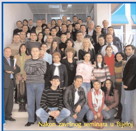
Nakon završnog seminara u Bijeloj