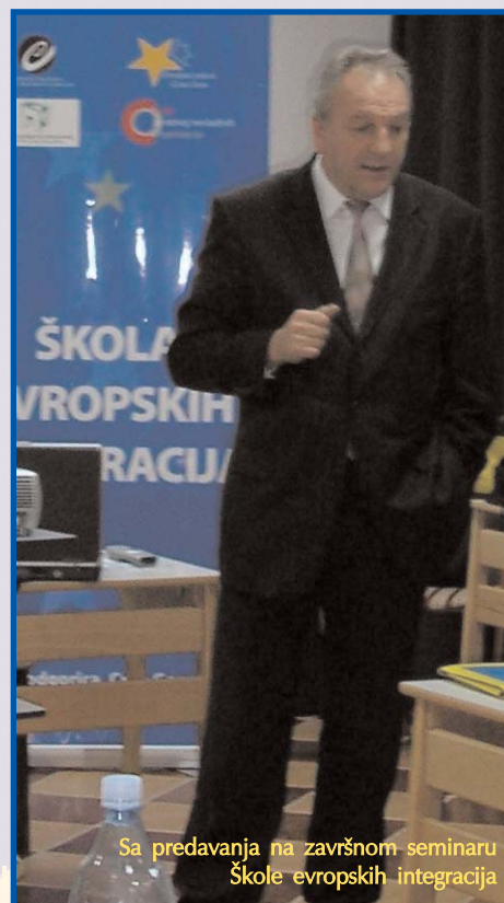
Sa predavanja na završnom seminaru Škole evropskih integracija

Kroz kohezioni fond ćemo u sljedećoj finansijskoj perspektivi dobiti ogroman novac. EU će to da plati 85%, a mi 15%. Vidite, o tome vi pregovarate.