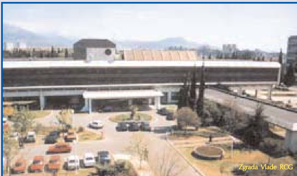
Zgrada Vlade RCG

U procesu pridruživanja Evropskoj Uniji Crna Gora neće biti prepuštena sama sebi. Kroz Twinning program, koji podrazumijeva vid bliske saradnje jedne od država članica EU i države u procesu pridruživanja sa ciljem ojačavanja administrativnih kapaciteta države koja hoće da uđe u elitno društvo, u Crnu Goru u februaru dolazi Renata Vitez . Ona će, kao predstavnica Republike Slovenije, u dužim vremenskim periodima boraviti u Crnoj Gori kako bi bogato slovenačko iskustvo prenijela na crnogorske kolege.