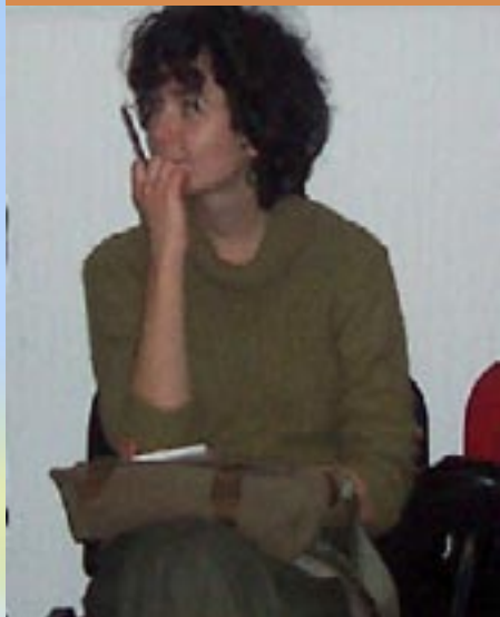
Piše: Vera Šćepanović

Opet smo, kažu, na pragu velikih historijskih događaja. Proces pridruživanja i stabilizacije počinje opštenacionalnom euforijom: ući ćemo u Evropu. Zatim dolaze tranzicije i transformacije, ekonomske i socijalne reforme, često na uštrb ionako niskih životnih standarda, tehnički uslovi prilagođavanja koji rastežu do krajnosti mrežu socijalne sigurnosti, guranje ličnih i građanskih sloboda u drugi plan pod izgovorom opšte političke reforme, i tako dalje u ime bolje budućnosti... U međuvremenu, neki od nas će možda stati da razmisle: ne samo kada, već ko i kako, i u kakvu Evropu?