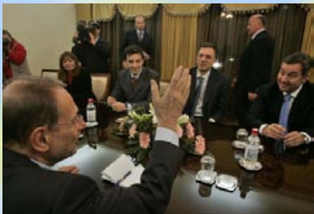
Visoki predstavnik EU i crnogorski zvaničnici 5. decembra u Beogradu

vore o pravilima za organizovanje izjašnjavanja građana o državnom statusu. Riječ je o bivšem ambasadoru Republike Slovačke u SCG Miroslavu Lajčaku, vrlo uglednom diplomati koji je trenutno politički direktor Ministarstva spoljnih poslo-