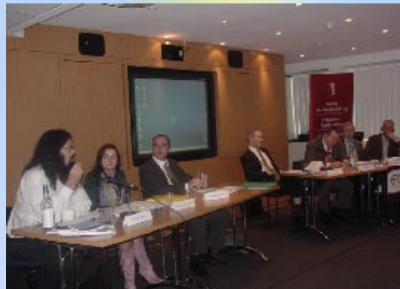
Sa okruglog stola u Briselu 7. decembra

Zajedničku izjavu o uslovima za dalju demokratizaciju Crne Gore potpisali su predstavnici Centra za građansko obrazovanje, Centra za razvoj nevladinih