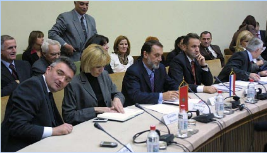
Sa prvog sastanka tri pregovaračka tima sa timom Evropske komisije

Crna Gora je, uporedo sa ulaskom u završnu fazu rješavanja svog državnog statusa, 7. novembra 2005. g. počela da polaže jedan od svojih najtežih ispita. Ukoliko uspije da ga savlada, značajno će se primaći i još poletnije krenuti ka društvu uređenih država. Država koje se, prije svega, prepoznaju po vladavini prava.