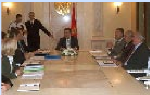
Sa jednog od sastanaka uoči početka pregovora

Kao što je neizvjesno u kojem će roku Crna Gora ispunjavati obaveze iz Sporazuma – za Hrvatsku je rok 6, a za Makedoniju 10 godina, još je neizvjesnije da li će